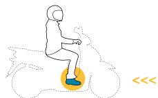
Conductores de ciclomotores