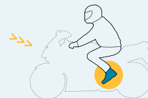
Conductores de motocicletas

Botas de motociclista Factor de protección: 89%